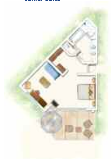
Suite Junior Junior Suite