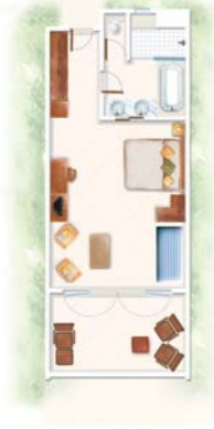
Chambre Supérieure Superior Room