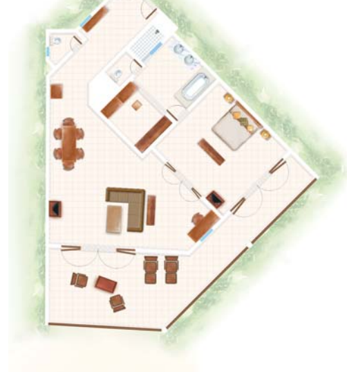
Suite Senior Suite Senior