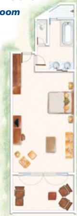
Chambre Deluxe Deluxe Room