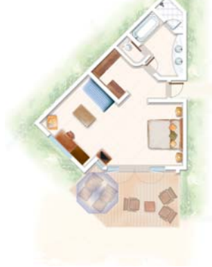
Suite Junior Junior Suite