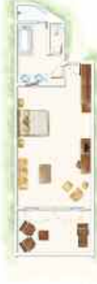
Chambre Deluxe Deluxe Room