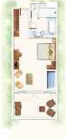
Chambre Supérieure Superior Room