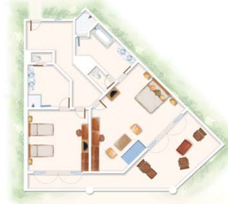
Appartement Famille Family Apartment